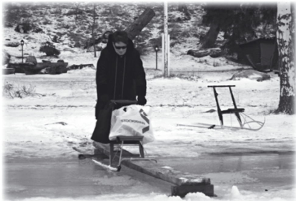
Työmatkalainen sinnittelemässä talvisen salmen yli.