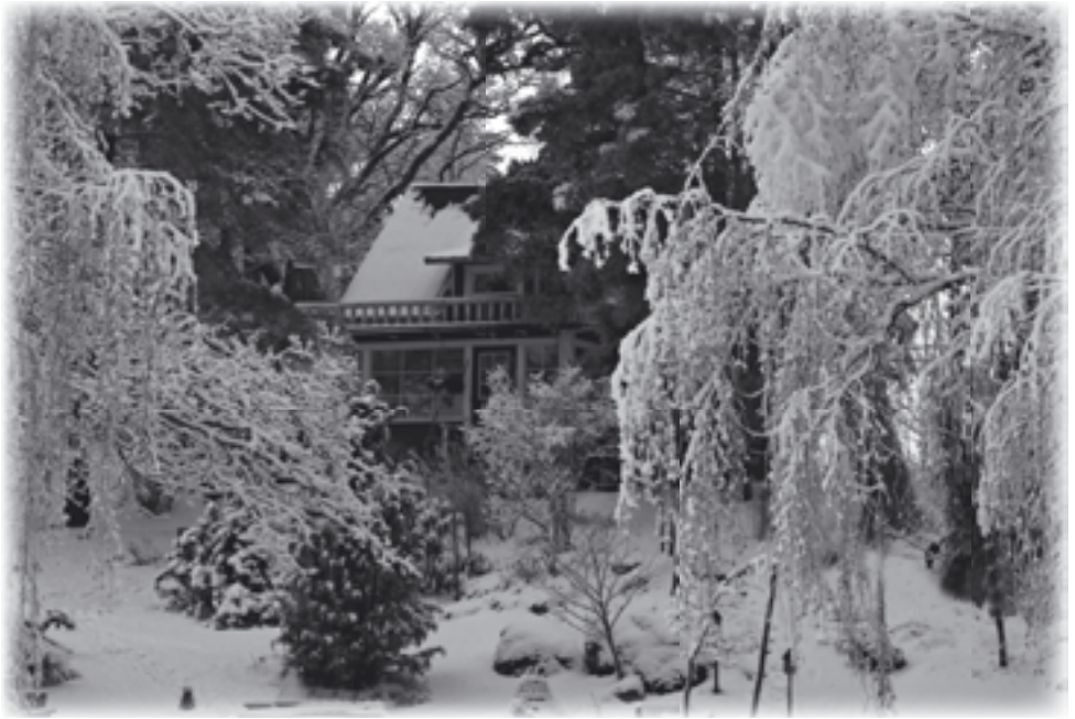
Pilkkumi talvisen puutarhansa keskellä.