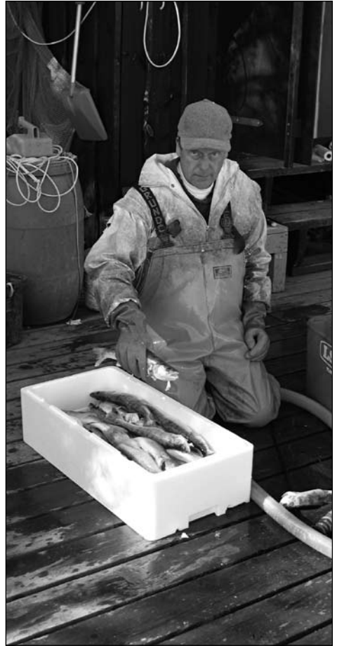
Naantalin Kalatrapin kuhalähetys valmistumassa

Vanhan huvilatontin muokkaaminen kalastuskeskukseksi oli haasteellinen tehtävä. Tontti oli tarkoitukseen erittäin ahdas, lisäksi osa huvilan rakennuskantaa haluttiin säilyttää, mutta suurin ongelma oli sen suuret korkeuserot. Kun rakennuksen leveyden mitalla korkeuseroa oli runsaat 4 metriä, oli tyydyttävän tuloksen aikaansaamiseksi mietittävä erikoisratkaisuja. Asuinkerroskin kaivettiin maanpuolelta 2/3 osaltaan maan sisään ja kellarikerrosta joudutaan meren puolelta vastaavasti pengertämään. Koko kalastuksen liikenne tapahtuu satamasta verkkovajan ja savustamon kautta talon itäpuolitse jäähdytys- huolto- ja varastotilaan ja lopulta lastauspihalle. Oma