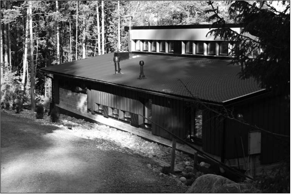
Tietyhteys ja tuleva lastaamo on lähes asuntokerroksen räystäään tasalla

lään kas kun tuli jätevesiongelma! Kun sitten vielä koko maakunnan jätevesi kootaan Aurajoen suulle, määrä kasvaa niin suureksi, että tehostuneista puhdistustoimenpiteistä huolimatta kuormitus Aurajoen suulla kasvaa. Kun sitten vielä tämän ”puhdistetun” jäteveden purkupaikaksi valitaan Tukholman laivojen kääntöpaikka, nämä huolehtivat siitä, että alta aikayksikön koko häiriö leviää yli koko Airiston. Kun lisäksi sataman ruoppausmassat läjitetään Airiston syvänteisiin laivaväylän viereen, myös tämä liete myrkkyyjämineen tekee samoin, vaikka kaikkein pahin myrkkyliete läjitettäisiinkin satamapenkereisiin. Vaikka Airiston Kalastusalue on toistuvasti viranomaisia näistä uhista valistanut, eivät nämä ole huomautuksista piitanneet. Silakan kutu ja kalastus on jo tuhottu, onko nyt ku-