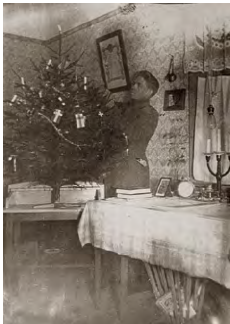
Joulu Laalahdessa.