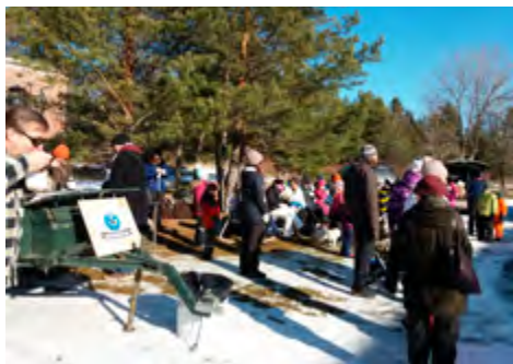
Nautitaan auringosta ja 50-vuotta täyttäneen Kaksikerran Erän tarjoamasta riistakeitosta