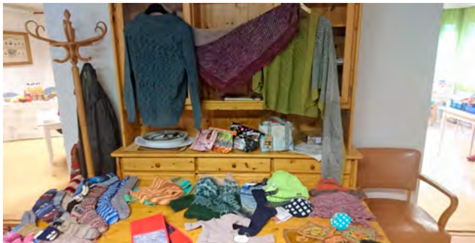
Kootut käsityöt kädentaidon päivällä.

”Neulomakerho, mun oma mar-tta-kerho. Mukava tavata iloisia ihmisiä joka toinen viikko. Aina on saanut apua ja neuvoa omiin askareisiin. Tutustuttu neulomisen ohella kasvivärjäykseen, savitöihin, nypläykseen ym. Puhe ja nau-ru raikaa.”