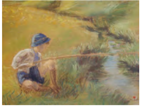
Tapani pienenä poikana ongella, Salme-äidin liitutyö.