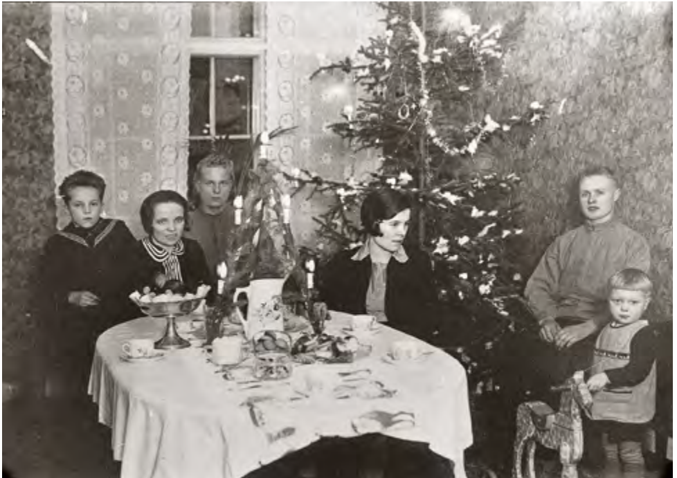
Rauhalan jouluinen kahvipöytä.