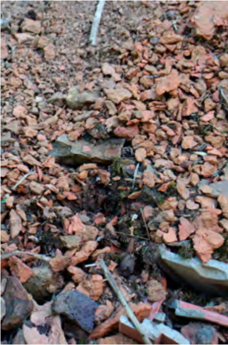
Maaunissa tapahtuvan tiilenpolton yhteydessä syntyy paljon tiilikuonaa, sillä reunimmaisiet usein murenevat poroksi ja päällimmäiset pöhöttävät liiallisen kuumuuden seurauksena. Kuva Ollilan tiilimiilun paikalta, KK 2017.