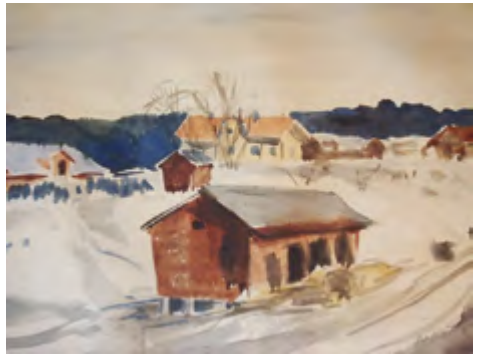
Kuralan Kylämäkeä, Kaija Laaksosen vesiväriyö.