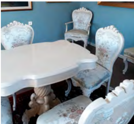
Brinkhallin uusia kalusteita.

Brinkhallin pihalla päästiin tuunamaan linnunpönttöjä mieleisikseen. Uudet pöntöt saivat värikkään kuosin lasten