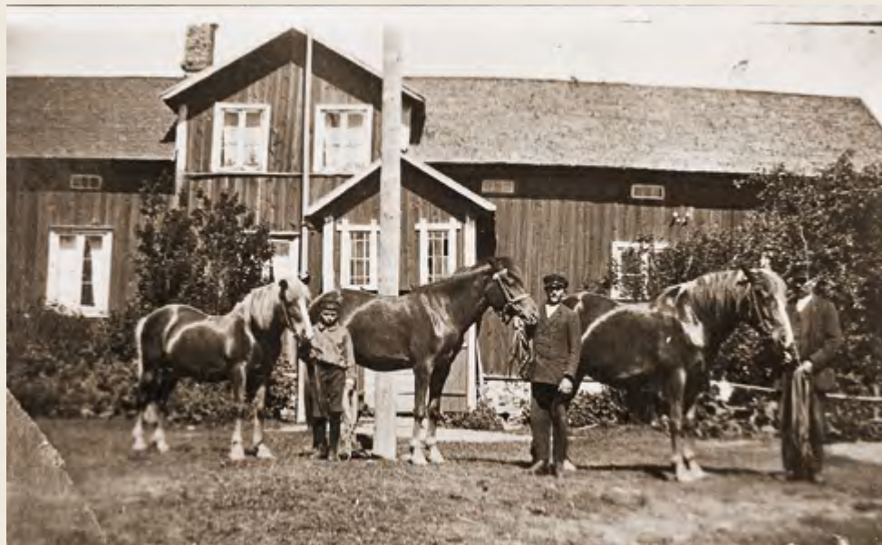
Viereinen sivu, ylempi kuva: Nikkilän Länsitalon isäntä perunannostossa.