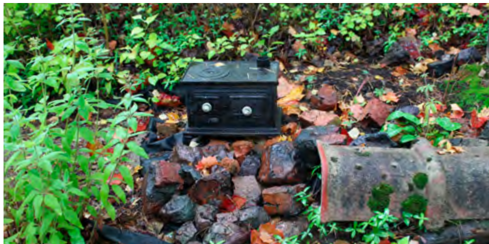
Tiilihaudankujan päässä olleesta tiilimiilusta on ympäristöön jäänyt paljon hylkytiiliä, joille kekseliät asukkaat ovat antaneet kiehtovan aseman piharakenteissa.

Perinneprojektin toinen tarkoitus oli kerätä tietoa vanhoista rakennuksista, joissa saarilla valmistettuja tiiliä mahdollisesti on käytetty. Tältä osalta tulos jäi aika niukaksi ja vahvasti aiempaa käsitystä saarelaisten mieltymyksestä hirsirun-