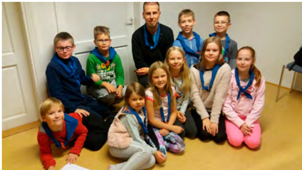
Kakskertatalolla viihdytään. Seikkailijat ovat ekaluokkalaisista sudenpennuista alkaen pitäneet yhtä.

Seikkailijat istuivat syksyisenä keski- viikkoiltana Kakskertatalon salin pöydän ympärillä pureksimassa kynänpätkiä. Vartiota johtava Jani on antanut heille tehtäväksi laatia varustelistan edessä olevaa laavuretkä varten. Viikonloppu- na suunnataan Teijon maisemiin.