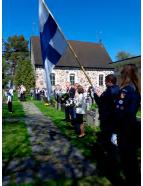
Kaatuneitten muistopäivä ja sankarivainajien muistaminen.

Sitten tultiinkin yhteen retken pääkohteista, Brinkhalliin. Brinkhall on myös Outi-oppaan bravuurikohteita. Brinkhallin ystävien pitkäaikaisena puheenjohtajana ja alueella partiolaisten kanssa