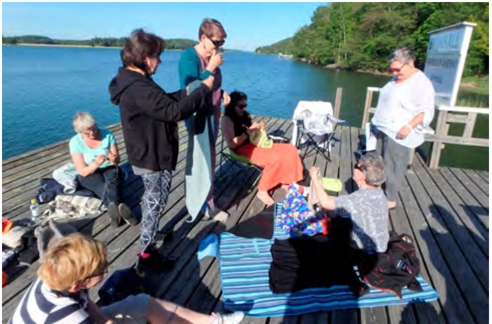
Neulomakerholaisia Brinkhallin laiturilla