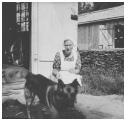
Pirtukätkön vahtikoira Frei revikavan edustalla.