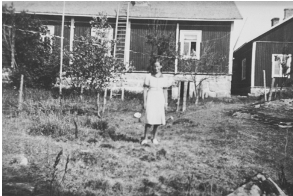
Raustvuoren asuinrakennukset mereltä päin.