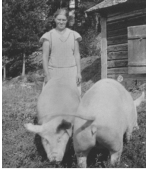
Raustvuoren palvelija ja sikoja 1930-luvulla.

Vänligin 1900-luvun alussa rakentama asuintalo, on säilyttänyt perinteisen ilmeensä.