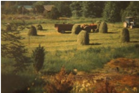
Tilalla on viisitoista viljeltyä hehtaaria, nykyään enimmäkseen heinällä.

Toukokuun viimeinen päivä oli perinteinen kylvöpäivä. Kun kylvö alkoi kasvaa, sitä piti harventaa. Silloin kutsuttiin sukulaiset talkoisiin.