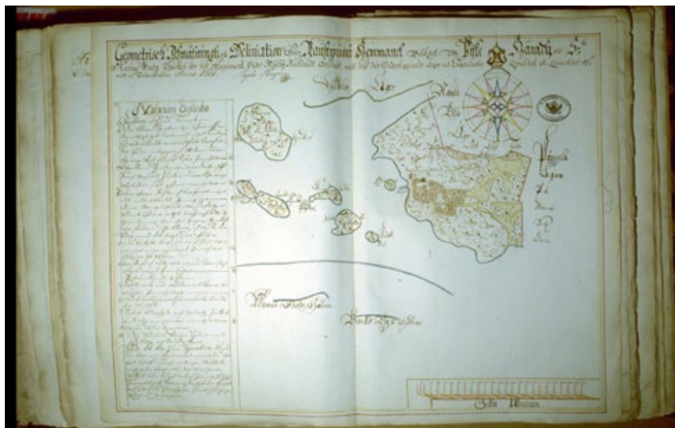
Raustvuoren taloudellinen kartta, 1691 Bergman. 1600-luvun maakirjakartat.

kuuluu useita pikkusaaria: Ihaluoto, Kuusiluoto, Honkaluoto ja Putkisaari, Hinttisten saaren eteläosa sekä pikkuiset Hylkeenkari ja Kruunukari. Nykypäiviin säilyneen Raustvuoren kantatalon jo keskiajalla raivatut viljelmät sijaitsevat korkealle kohoavien Kettuvuoren ja Raustvuoren välisessä laaksossa. Vapparin suuntaisen Kettuvuoren laella on kaksi pronssikaudelle ajoitettua hauta- röykkiötä. Ne viestivät alueen olleen mahdollisesti asutettu jo esihistorialli-