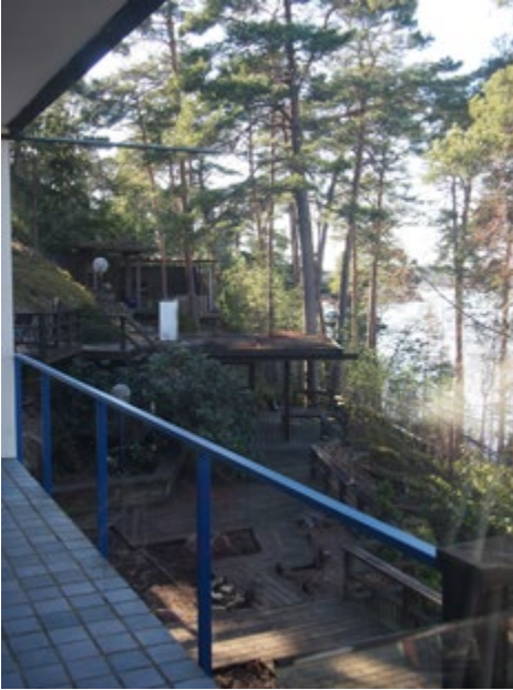
Talolta avautuva merinäköala.