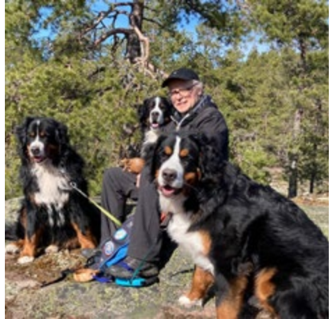
Puheenjohtaja ja koirat.

Talvikausi oli saarillamme mukavan luminen, sai jopa tehtyä perinteiset ladut kyläläisten iloksi ja hiihtäjiä riitti seurattavaksi asti, eikä laturaivoakaan täällä ilmennyt. Ainoa haitta olivat henkilöt, jotka eivät omista suksia ja joutu-