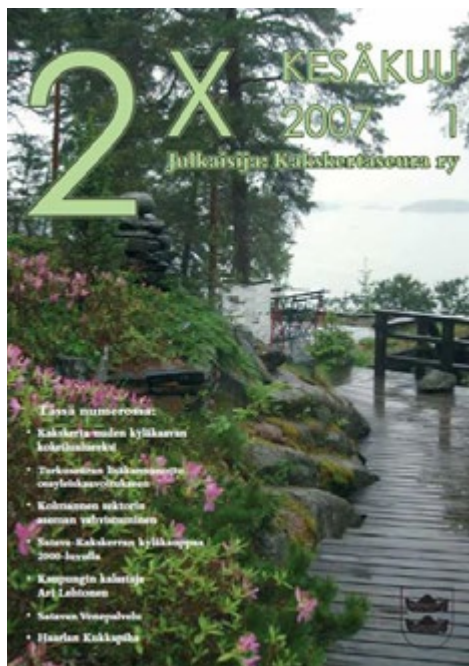
Kakskertaseura on jo vuosia ollut tietoinen tästä saarillemme kätkeytyneestä komeudesta.

Nyt 2021 vuonna päähuomion vie myös se valtava energian määrä, minkä talon ja puutarhan uudet omistajat ovat käyttäneet tämän satumaailman kunnostuksen aloittamiseksi. Tämä salainen metsäpuutarha on taas selkeästi otettu