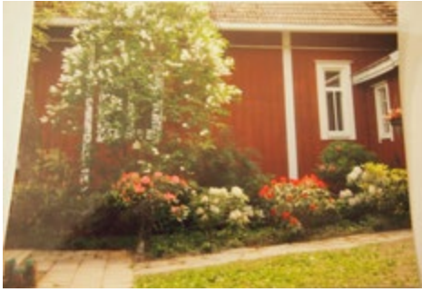
Muutaman vuoden takaisessa kuvassa pihapuutarhan alppiruusut ovat vielä pieniä. Nyt niistä on kasvanut jo pieni metsä.