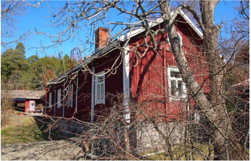
Tilan punamullatut rakennukset ovat 1800-luvulta.

Peltoa tilalla on 15 hehtaaria. Yhdellä hehtaarilla on viljelty avomaankurkkua. Risto-isäntä teki kätevästä miehenä kurkkukylvökoneet, joilla kylvötyö sujui joutuisasti.