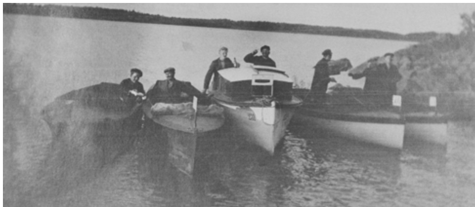
Moottoriveneitä Raustvuoren rannan tuntumassa 1930-luvun vaihteen tienoilla.